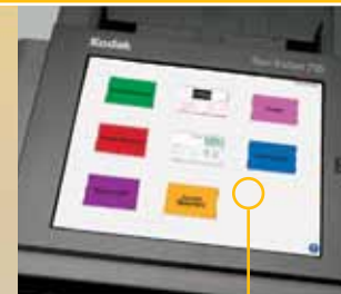
Grande tela sensível ao toque