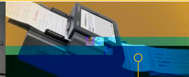
Manuseio aprimorado do papel