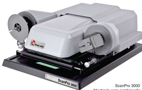
ScanPro 3000 Mostrado com combinação Ficha e Film Carrier Motorizado 16/35mm